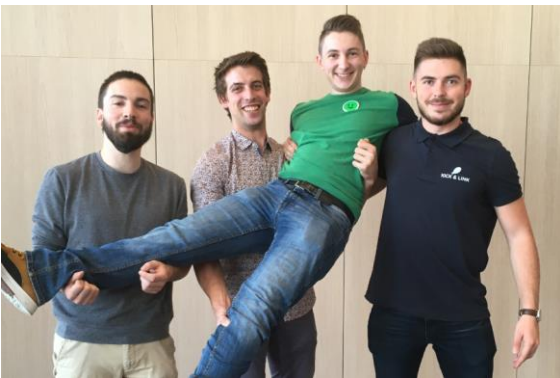
Photo prise lors de la journée des lauréats régionaux à Lyon le 26/09

Réponse le 10 octobre, en attendant vous pouvez découvrir le détail des projets en page 2.