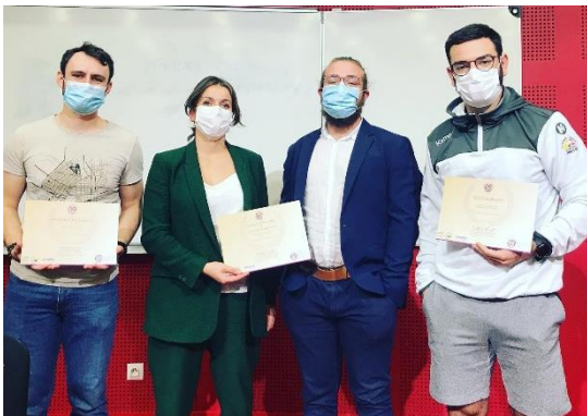
Photo prise lors de la cérémonie d'annonce des lauréats régionaux le 10/10/2021

Voici ci-dessous les 3 Lauréats régionaux du Clermont Auvergne PEPITE. Lequel d'entre eux est notre champion ?